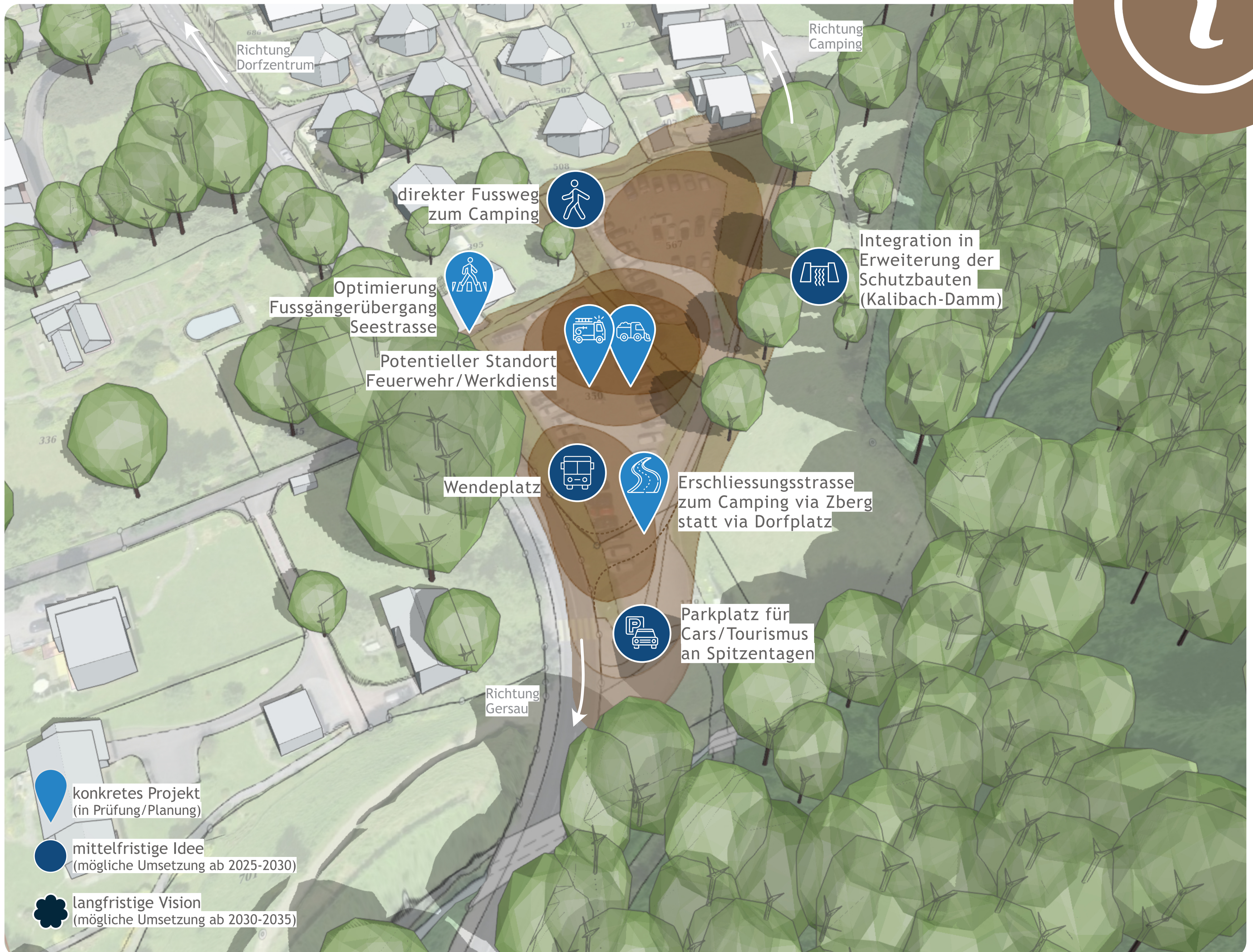
Feuerwehr und Gemeindewerkdienst